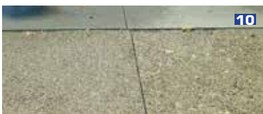
9 Détail de la Fontaine Arborescente, 2012.