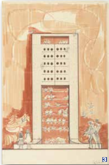
3 Croquis du pigeonnier pour le Jardin Grande-Allée, c.1972. Dessin de Czezia Zielinski.

néral, celle-ci marque un contraste avec l'importante surface gazonnée et les végétaux en bordure de rue. Bien qu'il n'ait jamais rempli sa véritable fonction, le pigeonnier reste un très bon exemple des possibilités qu'offrait le béton à cette époque. Bien conservée, cette structure de vingt pieds de haut a été initialement conçue pour résoudre le problème de la présence des pigeons sur les édifices environnants. ■