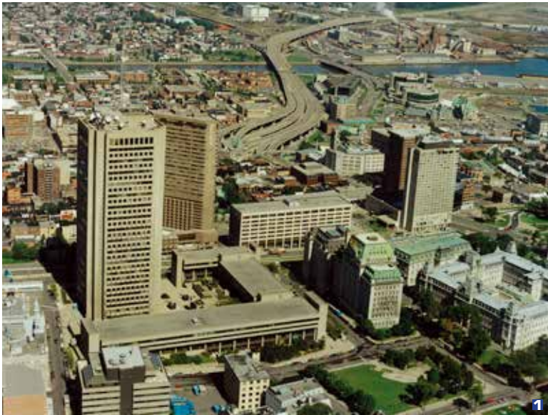
1 Vue aérienne du Parc de la Francophonie, 2008.